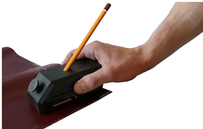
Рисунок 2.2 – Проведение испытания